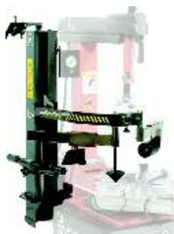
A fotón KIT BPS opcióval