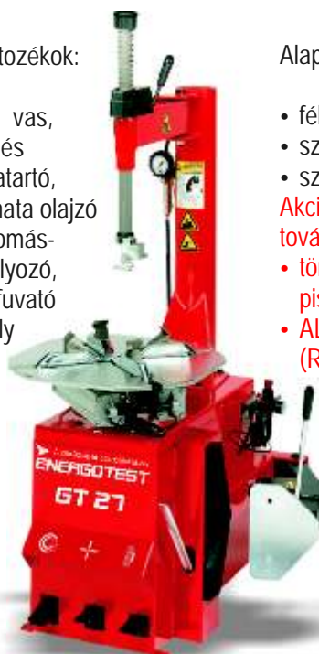
ENERGOTEST GT 27