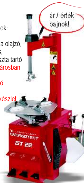
ENERGOTEST GT 22